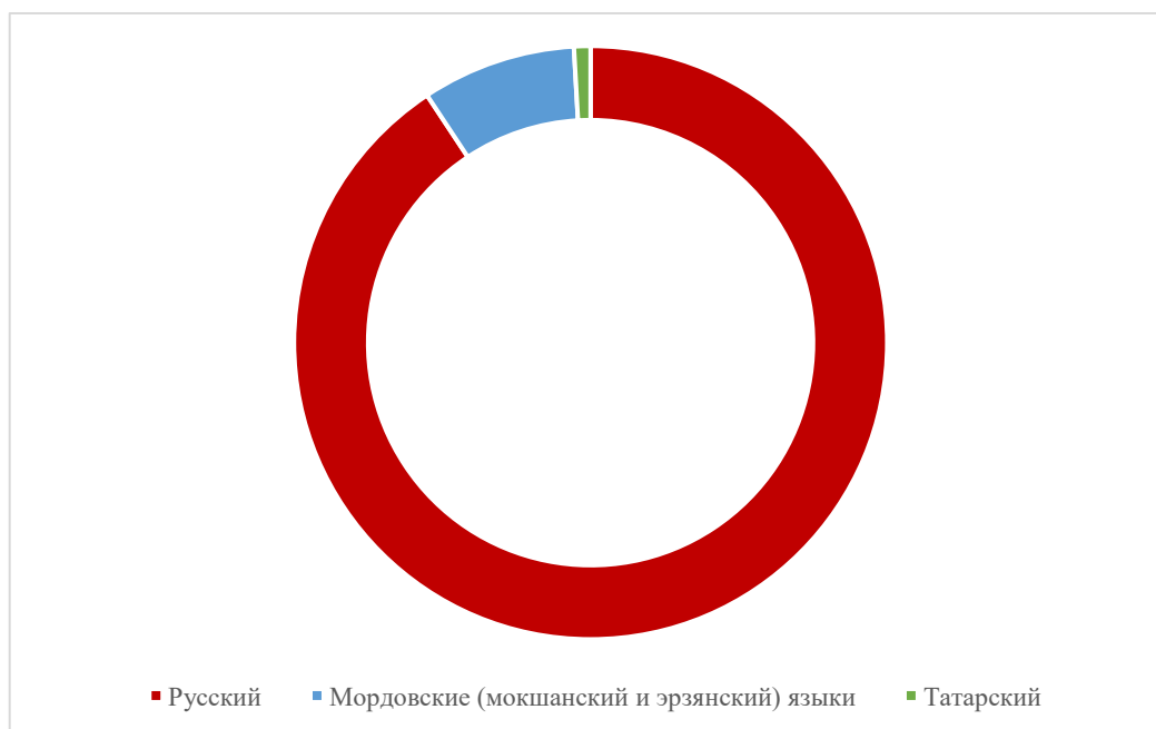
Рис. 2. Использование языков в общественных местах (2024 г.)

Согласно исследованиям НЦСЭМ за 2024 год, более чем в 90 % случаев общение в публичных местах происходит на русском языке и только лишь в 9 % – на мордовских языках (мокшанском и эрзянском) [Республика Мордовия глазами социологов, 2024: 280] (рис. 2).