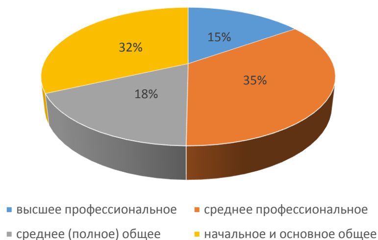
Рис. 2. Уровень образования женщин, совершивших преступления, % [Социальный портрет преступности]

Свою специфику имеет и социальный портрет женской преступности по состоянию на 2021 год (рисунок 2).