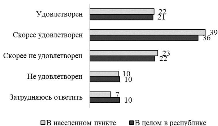
Рис. 1. Удовлетворенность качеством жизни на локальном и региональном уровнях

Наблюдаются различия в восприятии качества жизни жителей сельской местности и городской: доля селян, удовлетворенных своим качеством жизни как в регионе в целом, так и на уровне своего населенного пункта, более чем в 2 раза превышает долю таковых среди горожан (36 против 14 % соответственно). Очевидно, более высокие оценки качества жизни среди сельских жителей (преимущественно старшей возрастной категории) связаны не только с уровнем притязаний, отличным от городского жителя, но и с меньшим разрывом социально-экономических характеристик внутри его референтной группы. При этом позитивные оценки «локального» качества жизни сельские жители проецируют на региональный уровень.