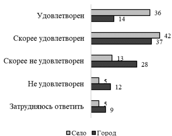
Рис. 3. Удовлетворенность населения качеством жизни на локальном уровне

Кроме того, различия в оценках городского и сельского населения обусловлены особенностями проживания в селе: благоприятной средой для общения и взаимодействия, «выстроенной» сетью социальных контактов.